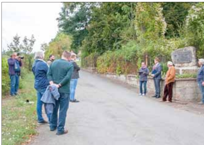
Gedenkstein der FIR am ehemaligen KZ Bad Sulza