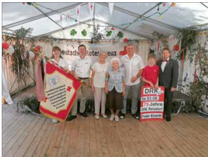
Treffen der Generationen, in der Mitte, die beiden DRK Gründungsmitglieder