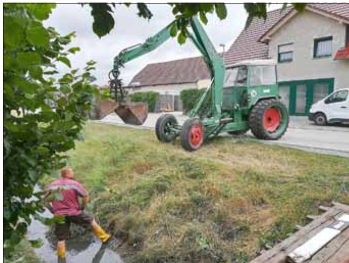
Arbeiten am Seenachbach